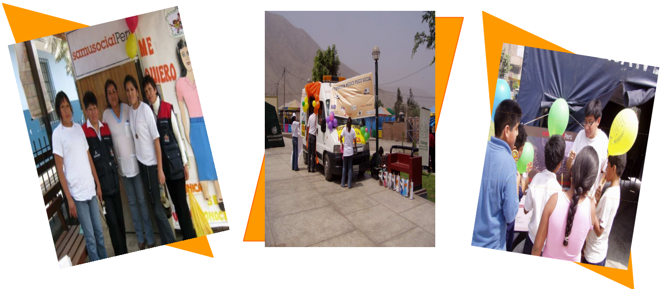
Participation de l'équipe du CPRS aux diverses campagnes et activités de cette période

Cette année, à Huaycán a été organisé un défilé pour rappeler cette date, et une unité mobile du Samusocial Perú a parcouru les principales avenues de Huaycán en diffusant au haut-parleur des messages préventifs et de sensibilisation à toute la population. L'équipe est également intervenue avec des jeux éducatifs au cours de la « feria », fête de quartier qui s'est déroulée au Parc du 7 Novembre, près de l'hôpital de Huaycán.